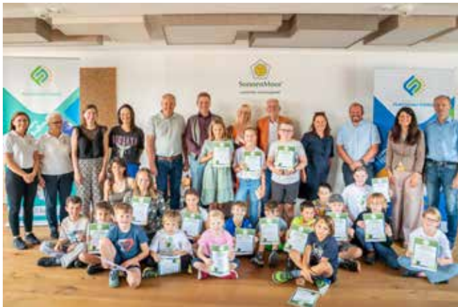
Abschluss bei der Firma SonnenMoor

Insgesamt wurden 48 Kinder und Jugendliche aus den neun Mitgliedsgemeinden der LEADER-Region Flachgau-Nord betreut. Das ganztägige Ferienprogramm (07:30–16:00 Uhr) fand vom 14. bis 25. Juli 2025 in Anthering und Bürmoos statt.