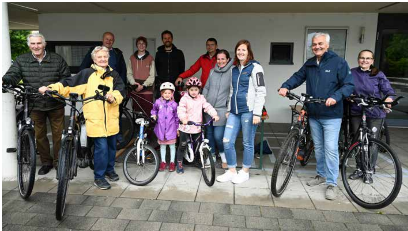
Kostenloser Fahrradcheck in Göming

Am Donnerstag, 22. Mai 2025, fand in Göming der jährliche kostenlose Fahrradcheck statt. 25 Fahrräder wurden von der Firma VeloCulTour fit für den Frühling gemacht. Die Kosten werden von der Gemeinde Göming übernommen.