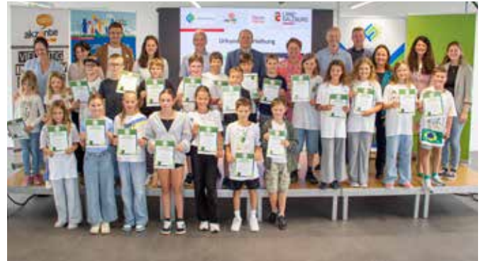
Workshop erneuerbare Energien und Schall bei W&H

Sie lernten die Grundlagen der Kreislaufwirtschaft, Abfallvermeidung, und künstlichen Intelligenz kennen, mikroskopierten, upcycelten Möbel und Spielzeug und setzten sich kreativ mit nachhaltigen Materialien auseinander.