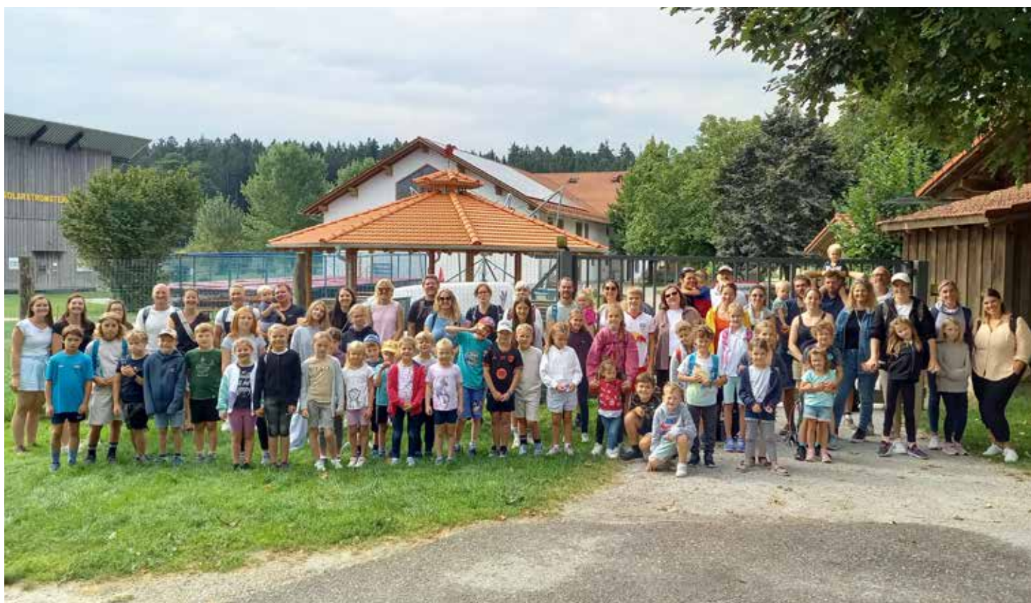
Ferienabschlussausflug des Göminger Ferienprogramms zum Wildfreizeitpark Oberreith