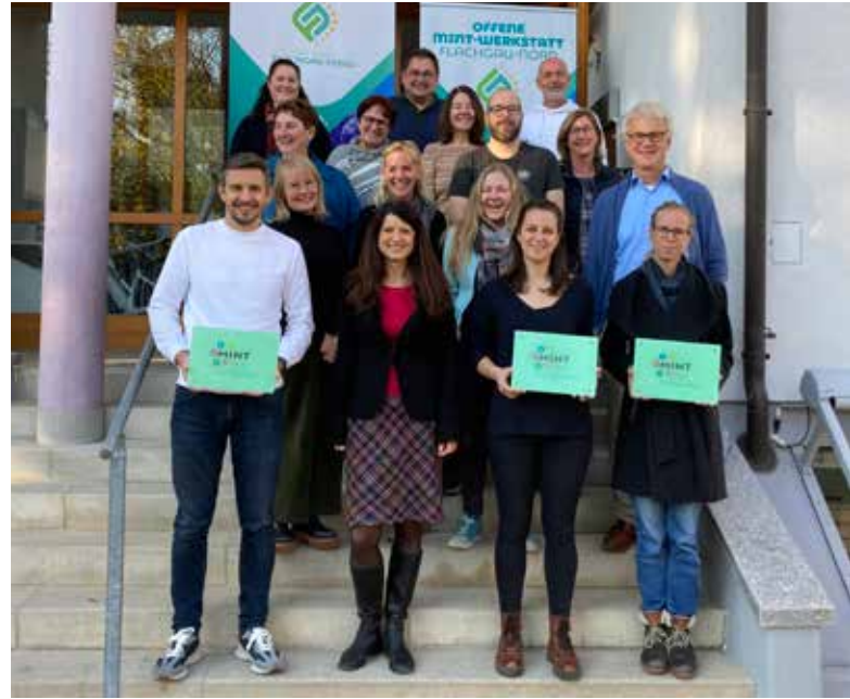
MINT-Region Flachgau-Nord