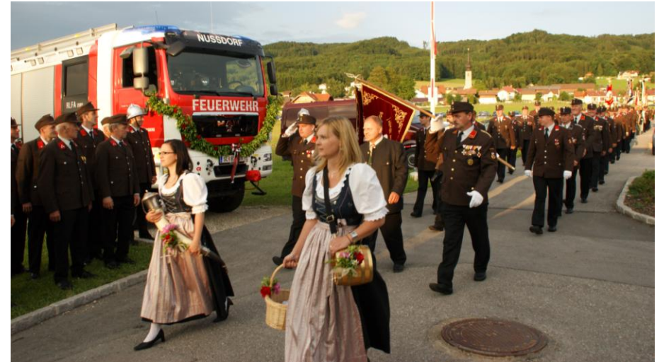
21.05.2011 Fahrzeugsegnung in Nußdorf