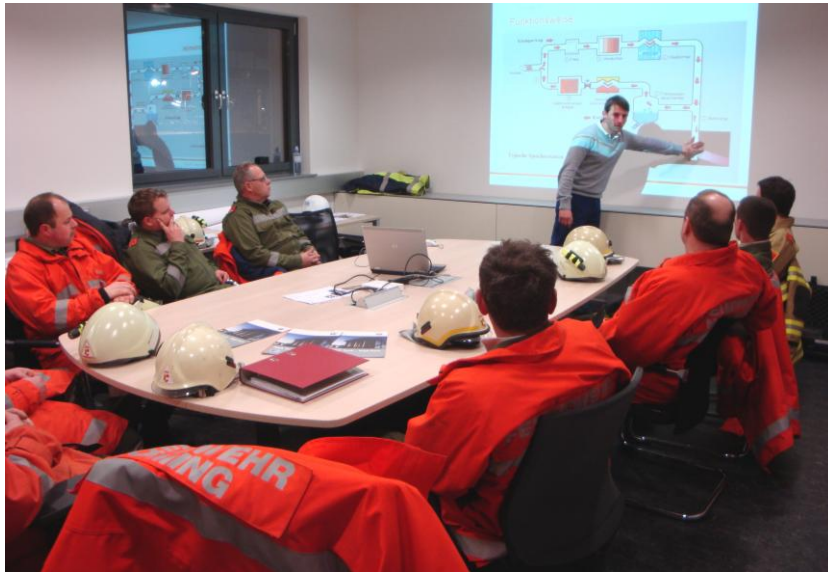
08.02.2011: RAG – Gasspeicher Göming Nord und Süd Schulung der Brandmeldeanlagen