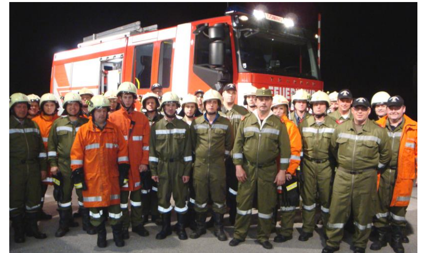
25.03.2011 Übung und Geräteschulung: Einteilung in drei Gruppen. Abwechselnd wurde an den Fahrzeugen und den verschiedenen Gerätschaften geübt.